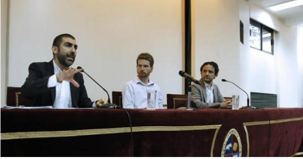
Universidad de los Andes